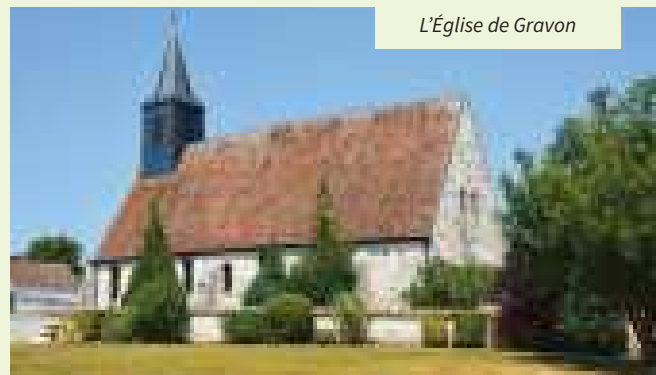
L'Église de Gravon