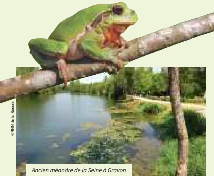
Ancien méandre de la Seine à Gravon

Sa silhouette est difficile à observer. « il pleut, il mouille, c'est la fête à la grenouille », chantent parfois les enfants... De nombreux oiseaux migrateurs se reposent dans les gravières de la rive gauche de la Seine.