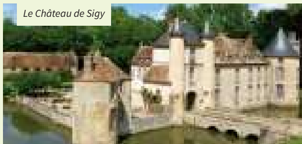
Le Château de Sigy

il fut édifié au cours de la guerre de 100 ans, remanié au XVII e siècle. Il est construit sur pilotis et entourés de douves larges de plus de 35 mètres à certains endroits.